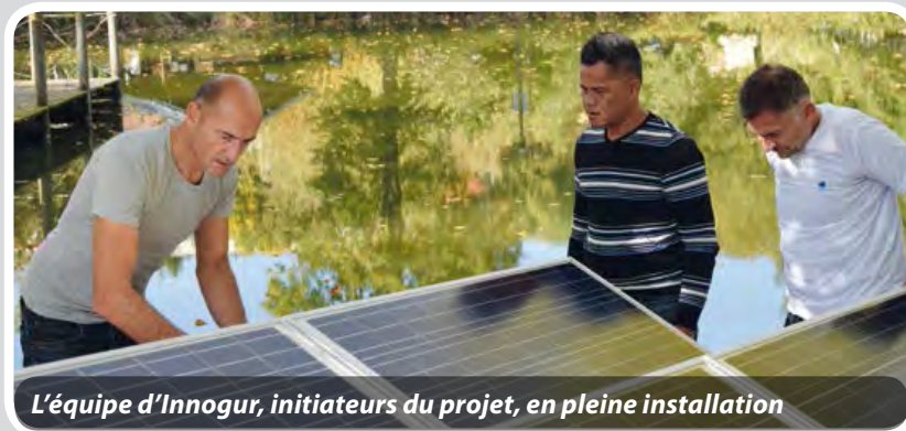
L'équipe d'Innogur, initiateurs du projet, en pleine installation

La plateforme autonome de dépollution, en expérimentation dès 2013 sur notre lac du Mail, est définitivement installée. Une opération rendue possible grâce au crowdfunding (financement participatif) : plus de 20 000 € (110 % de l'objectif) ont été collectés ! Merci encore à tous les contributeurs !