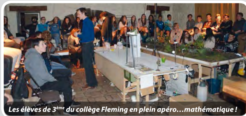
Les élèves de 3 ème du collège Fleming en plein apéro...mathématique !

Un apéro pas comme les autres suivi d'un spectacle, le tout sur les mathématiques, présenté par une troupe d'acteurs un peu fous : c'est aussi cela la fête de la science !