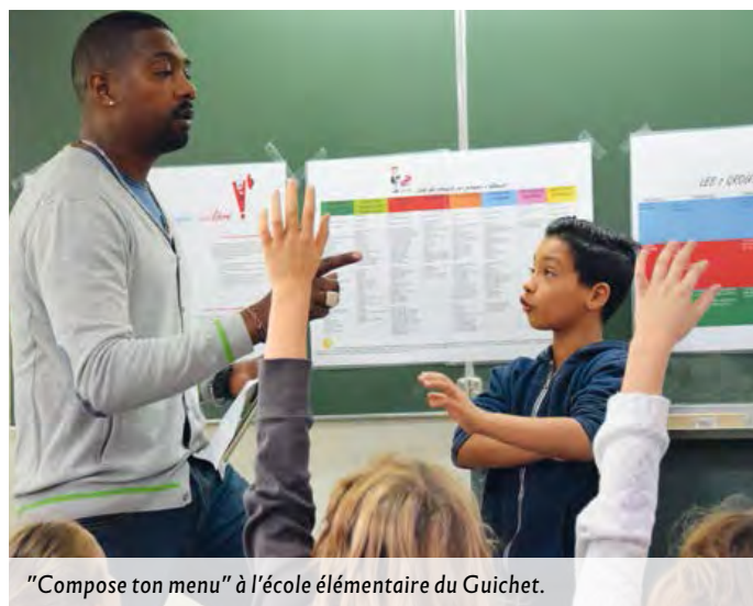
« Compose ton menu » à l'école élémentaire du Guichet.

Parmi un choix de quatre goûters équilibrés, les enfants ont voté pour leur préféré. Chaque jour, les votes étaient comptabilisés et à la fin de la semaine, les deux goûters ayant obtenu le plus de suffrage ont été élus.