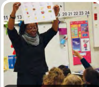
Maternelle du Centre