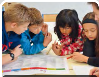
Elémentaire de Mondétour

Et si les enfants concoctaient eux-mêmes leurs menus de la semaine ? Challenge relevé en animation périscolaire dans les écoles Orcéennes. Guidés par un animateur, ils ont décidé d'un menu d'un jour -équilibré bien sûr- qu'ils retrouveront un midi, prochainement dans leur assiette ! Les enfants de l'école Sainte Suzanne ont découvert des saveurs et les ateliers de préparation de la Maison Gasdon et de la boulangerie La Pause Gourmande.