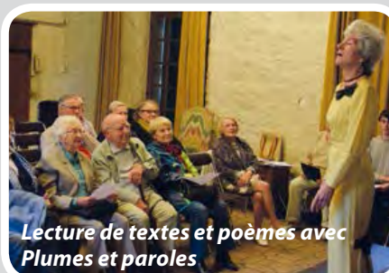
Lecture de textes et poèmes avec Plumés et paroles