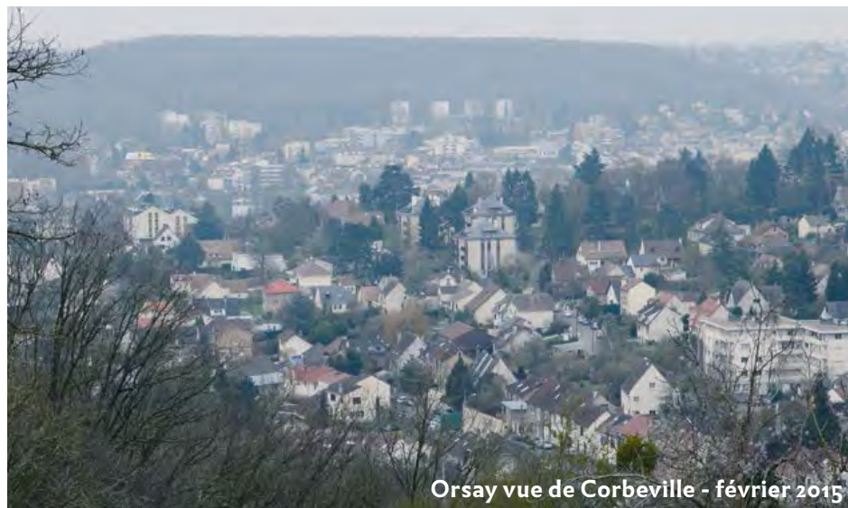
Orsay vue de Corbeville - février 2015