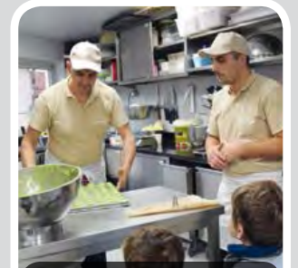
La Pause Gourmande