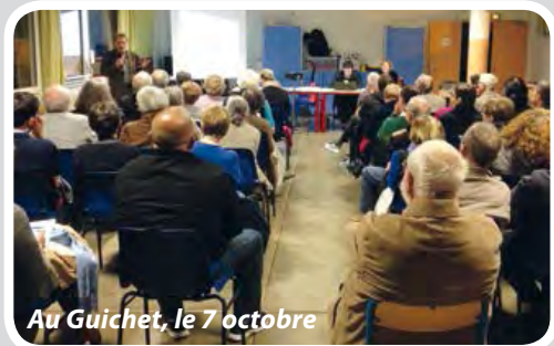
Au Guichet, le 7 octobre

A chaque quartier son conseil. Au cœur de la vie démocratique locale, les conseils de quartier sont l'occasion d'échanger pour avancer. PLU, actualités des quartiers, travaux, agendas et évènements, échanges divers. Retrouvez très bientôt les lettres de vos quartiers, distribuées par vos élus !